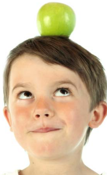
Kinder schulen Kommunikation

wachsene dagegen akzeptieren häufig den Status Quo, finden sich mit Situationen ab, entwickeln weniger ihr kreatives Potenzial und vergessen, dass es auch noch eine